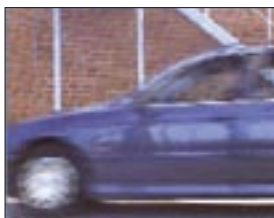
Zwischenzeilenabtastung, 20 ms Unterschied zwischen ungerader und gerader Zählung