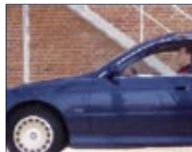
Progressive Abtastung, alle Zeilen werden gleichzeitig erfasst.

Die progressive Abtastung wird anstelle der Zwischenzeilenabtastung von CCTV-Analog-kameras (PAL/NTSC) verwendet. Bei der progressiven Abtastung werden alle Pixel (Zeilen) gleichzeitig erfasst, so dass Bewegungen ohne Verzerrung wiedergegeben werden können.